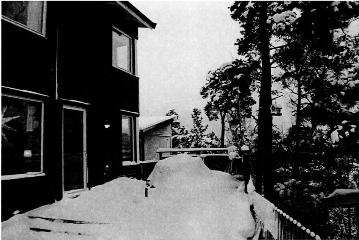
Bak sida med uteplats i österläge.